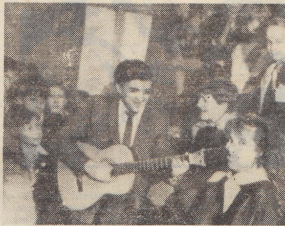
Тесным кружком собрались вокруг Иржи Клапки гости из Чехословакии и ребята из интернационального клуба 209-й московской школы.

школьниками, но и выступали с небольшими концертами, посвящёнными Пушкину. Дали они концерт и в 209-й московской школе. Выступление прошло с большим успехом.